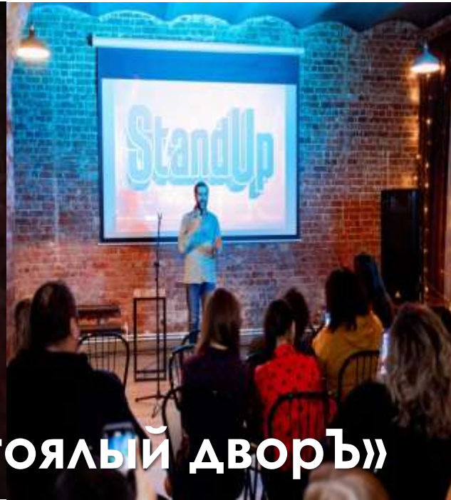
АРТ-пространство «Постояль дворь»