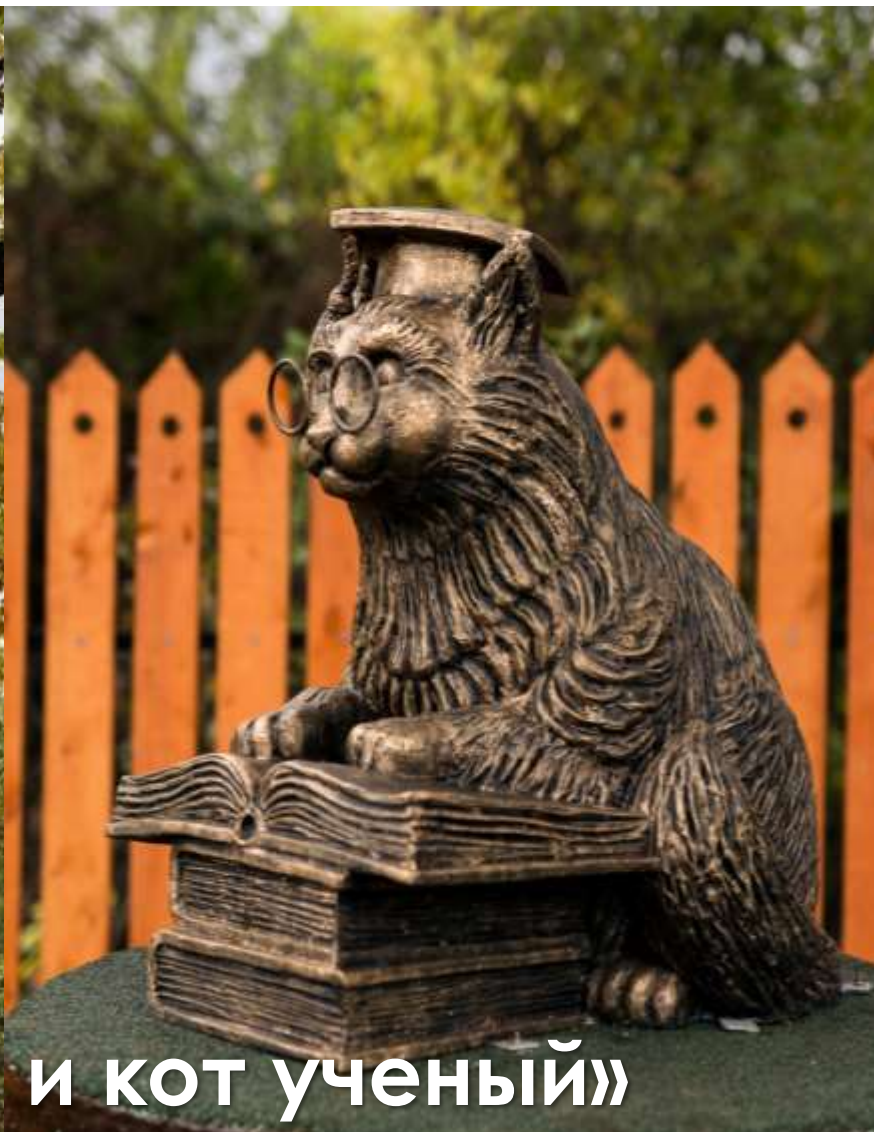
«Дуб старожил и кот ученый»